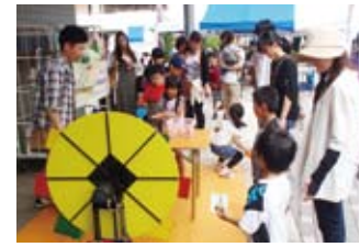
ゲームコーナーに子ども達も大喜び