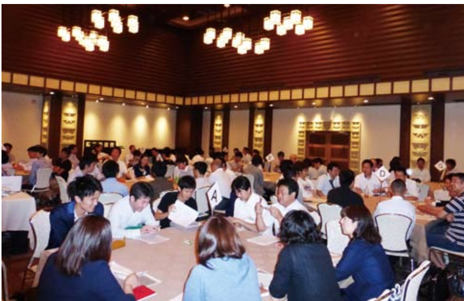
○×クイズの出題に班ごとに考える