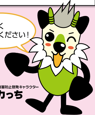
長野県消費者被害防止啓発キャラクター もシカっち