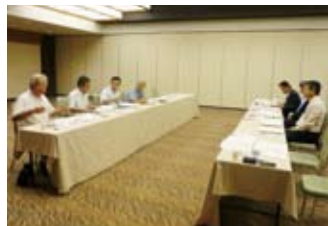
顧問弁護団会議の様子

8月22日(金) 松本市の美ヶ原温泉「ホテル翔峰」において開催されました。冒頭事務局から長野県労働者福祉協議会の一年間の活動報告、ならびに法律相談の現状等について提案し、確認されました。 その後の話し合いの中で、最近では、相談内容が多様化しているため、今後の法律相談がスムーズに行われるよう、弁護団の皆様との活発な情報交換が行われました。