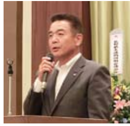
通常総代会で挨拶する関本部長

本無線労働組合、業務委員長賞にはルビコン労働組合と小諸村田製作所労働組合の作品が受賞されました。