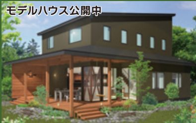
モデルハウス公開中